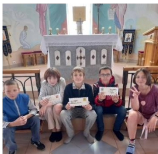
Дети держат в руках письма, которые они написали Богу.