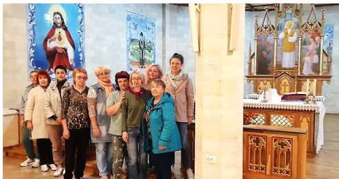
Перед мощами блж. Владислава.

времена безбожия он, как и блаженный Алексей Зарицкий, как и другие священники, жил и трудился, освещая своей пастырской и миссионерской деятельностью жизнь верующих в Средней Азии.