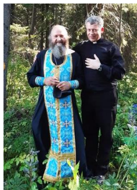
С о. Валерием на пути.

В письме митрополит подчёркивает, что «Можно увидеть много параллелей в явлении Божьей Матери Обвинской с событиями в таких местах как Ла-Салетт, Лурд и особенно Фатима». «Именно в это напряжённое время, - пишет митрополит, - уместно подумать о возможности установления партнёрства между названными двумя святынями. Можно предположить, что такая связь будет способствовать развитию почитания Божьей Матери Обвинской и сделает святыню известной за пределами России».