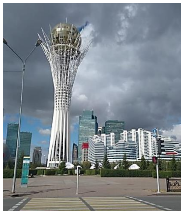
Башне Байтерек в Астане отметили в эти дни 20-летие.