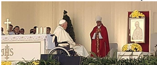
Папа Франциск перед иконой Пресвятой Девы Марии Фатимской в конце Св. Мессы в Нур-Султане.

У пророка Исаии находятся трогательные слова: «Как прекрасны на горах ноги благовестника, возвещающего мир, благовествующего радость, проповедующего спасение, говорящего Сиону: „воцарился Бог твой!“» (Исаия 52:7) Именно в этом духе мы хотим приветствовать нашего архиепископа как посланника мира. Прошу вас с полным вниманием отнестись к его посещению нашего прихода и действительно