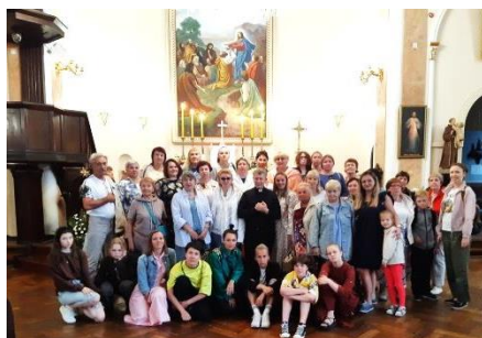
В церкви Пресвятой Девы Марии Лурдской в Санкт-Петербурге.

В духовной семинарии, где мы проживали, мы праздновали окончательную Мессу и вспоминали самые яркие моменты пережитого паломничества. Нам оставалось только благодарить Бога и высказать просьбу: Пусть мученики XX века заступятся за нас перед Богом и укажут нам правильный путь в нашем настоящем.