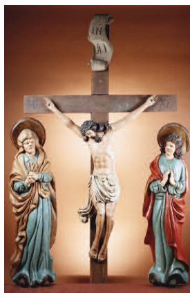
Группа Распятия (высота фигур 130 см, 18 век, Нижне-Чусовские городки).

Скульптуры страдающего Христа также восходят к западным прототипам. Под влиянием таких мистиков, как Бернард Клервоский, Бонавентура и Гертруда фон Хелфта, поклонение страданиям Христа нашло отражение в изобразительном искусстве. Голландская скульптура конца 15-го века изображает об-