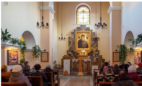
Католический храм Божьей Матери иконы Её Неустанная Помощь в Петрозаводске.

Среда, 3 августа: 23:55 Прибытие в Пермь. Отправление в Березники на автобусе.