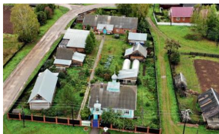
Вид на монастырь в Обвинске, который после Советского режима был восстановлен в 1997 году.

После перестройки архиепископ Пермский и Соликамский Афанасий Кудюк смог вернуть монастырь к жизни в 1997 году. В центре внимания жизни монастыря - «Обвинское чудо», как сегодня называют Явление Богородицы более 300 лет тому назад. На фоне трагической истории можно понять, почему это благодатное место до сих пор ведёт скрытое существование в бедных условиях. Обвинские события даже в Пермском крае почти неизвестны.