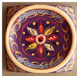
Сувенир из глины с надписью «Обвинская Роза - на Пермской земле».

В Фатиме Богородица необыкновенным образом попросила всю Вселенскую Церковь принять участие в судьбе русского народа и молиться за «обращение России», особенно Розарием. Обвинск представляет особую связь с Фатимой: предсказания и обещания в отношении России образуют уникальную точку соприкосновения экуменического движения. Таким образом, было бы очевидным инициирование партнёрства между Обвинском и Фатимой, которое могло бы помочь Обвинску также стать процветающим паломническим центром для всех христиан.