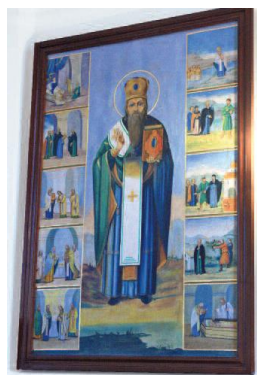
Икона св. Стефана Пермского в Католическом храме Непорочного Зачатия Марии в Перми.