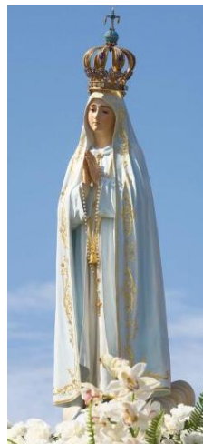
Статуя Пресвятой Девы Марии Фатимской.

Просьба построить часовню или церковь идентична другим Явлениям, особенно также повеление провести процессии, как это произошло в Лурде в 1858 году. Обвинск также связывает с этим местом паломничества и дар целебного источника.