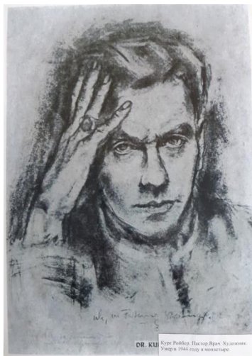
Автопортрет Курта Ройбера

Примерно 600 из них умерли во время содержания под стражей и были похоронены в особой части Елабужского кладбища.