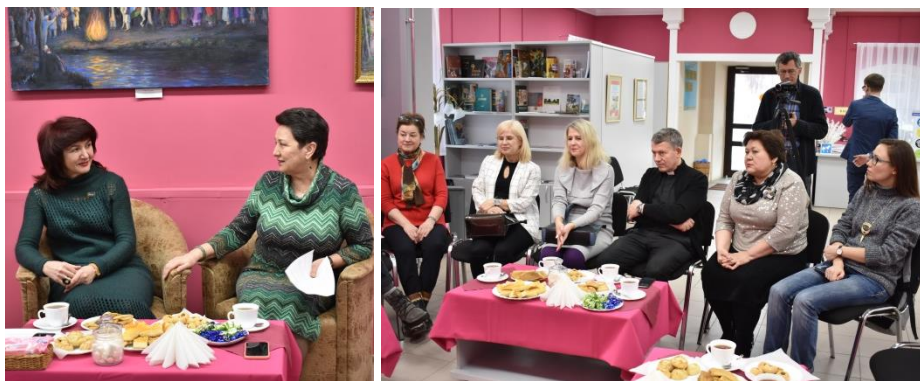
Слева: директор музея-заповедника и замглавы Елабужского района по социальной и культурной сфере. Справа: делегация из Березников.