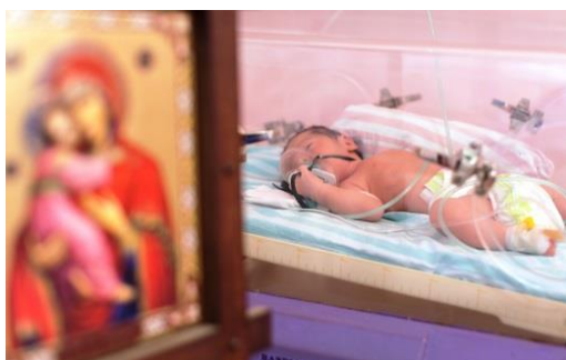
Малыш в преждевременной палате больницы в долине христиан в Сирии.