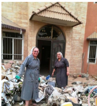
Ефремитки из Каракоса убирают свой разрушенный монастырь.

Террористическое подразделение «Исламское государство»* в Ираке потерпело военное поражение. Но политическая ситуация напряжённая. Христианское бегство из страны продолжается. До 2003 года в Ираке проживало около 1,5 миллиона христиан, в 2019 году оно было значительно ниже 150 000. Остальные христиане по прежнему подвергаются дискриминации и нападениям. Деревни Ниневийской равнины, веками являвшиеся поселениями христиан, нуждаются в восстановлении. 46 процентов христианских беженцев вернулись в свои деревни.