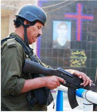
Военные посты перед церковью в Пакистане.

бомба. Молодой человек пожертвовал своей жизнью, чтобы защитить свою общину.