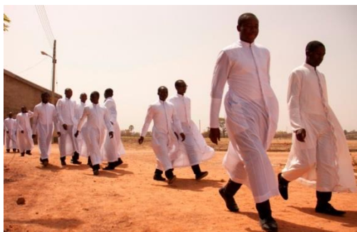
Семинария в Нигерии.

Смерти в Нигерии продолжают. Исламистские группировки продолжают причинять вред на севере страны. В центральной Нигерии христианские фермеры страдают от нападений фулани, кочевого племени преимущественно мусульманского. Преследование имеет экономические и религиозные причины. Сотни тысяч людей становятся беженцами.