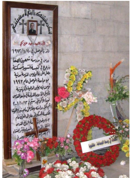
Могила священника-мученика Рагхеда Ганни из Мосула в Ираке.

«Как я могу закрыть дом Божий?» - отвечает Ганни. Это его последние слова. Вместе с тремя священнослужителями он умирает под градом пуль.