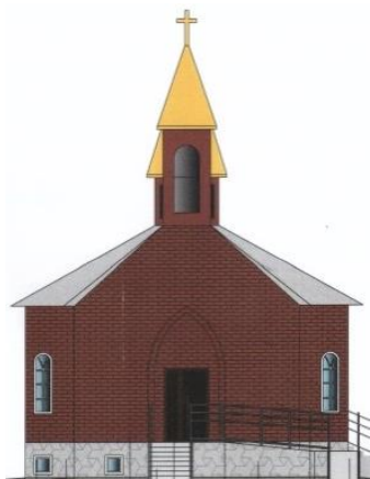
Вид на главный вход.

о. Тадеуш Дроздов, иезуит из Варшавы, который в будущем хочет помочь в нашем приходе, с девушками из приёмной семьи Кати Мухариновой на участке под строительство часовни Св. Анны.